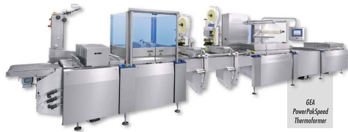
GEA PowerPakSpeed Thermoformer

♦ Un alt partener Darimex Techno prezent la târgul de specialitate Interpack 2014 este compania GEA pe care o puteți găsi în Hala 7, standul B06. Printre noutățile pe care le puteți