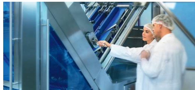
GEA GigaSlicer, echipat cu sistemul GEA OptiScan, sistem de scanare cu raze X

Gama de mașini GEA PowerPak s-a diversificat cu mașinile tipul ST pentru ambalarea cu mare viteză, RT cu o viteză medie de lucru, cu opțiunea schimbării sculelor de lucru semiautomat, ceea ce elimină munca 100% manuală, precum și cu GEA PowerPakXT, care are ca destinație folosirea în sisteme medicale, ambalarea de medicamente, instrumente medicale etc.