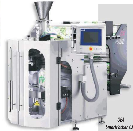
GEA SmartPacker CX

ambalarea a 250 pungi pe minut, precum și mașina DOYSTYLE ce poate fi folosită la ambalarea a 100 de pungi pe minut. O altă noutate este mașina CX 400, unde sudura foliei se face cu ultrasunete și poate lucra cu filme OPP de 30 microni. Genul acesta de pungi este perfect pentru ambalarea de salate, realizându-se astfel o economie însemnată de material pentru ambalare.