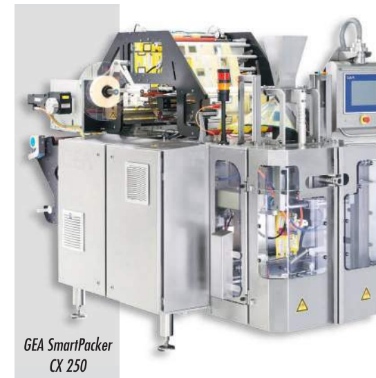
GEA SmartPacker CX 250

Gama GEA de Traysealere este, de asemenea, prezentată cu noi tipuri de mașini care permit ambalarea de la carne proaspătă la diverse tipuri de mâncăruri și salate, mașini capabile să fie adaptate după cerințele clienților.