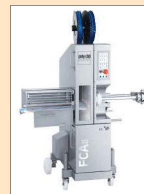
POLY-CLIP: Mașina automată pentru dubla clipsare FCA 80