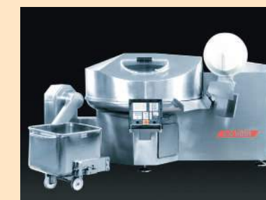
K+G WETTER: Vacuum-Bowl-Cutter 200 L STL