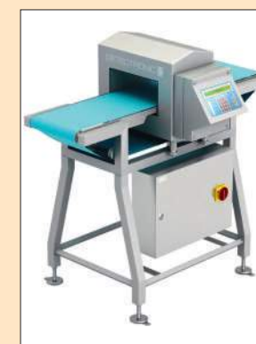
DETECTRONIC: Detectorul de metale sistem tunel, cu fereastră